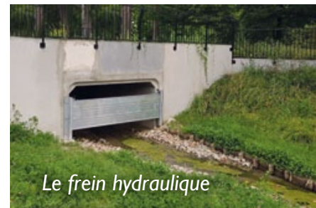
Le frein hydraulique

écoulements de la rivière, alors même que les ouvrages d'écrêtement ne pourront voir le jour qu'en 2020. La pose d'un frein (plaque de métal) doit permettre de ralentir l'écoulement des eaux en cas de crue en direction des communes situées en aval - notamment Muirancourt, Bussy et Noyon.