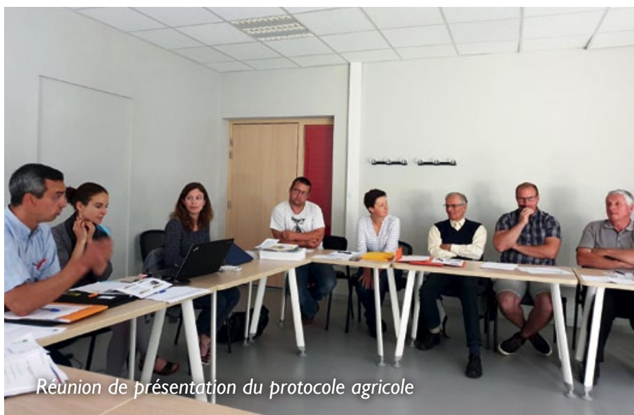
Réunion de présentation du protocole agricole

de l'Oise, la FDSEA 60 et l'Entente Oise-Aisne. Le calendrier a été rappelé : après une enquête publique à l'automne 2019, l'arrêté préfectoral autorisant la réalisation des ouvrages est attendu pour le début de l'année 2020. La construction des deux bassins pourra alors commencer à l'été 2020. L'arrêté préfectoral de servitudes de surinondation interviendra après les travaux. Une fois les servitudes prescrites, les conventions d'indemnisation pourront être signées de gré à gré avec les propriétaires et exploitants concernés.